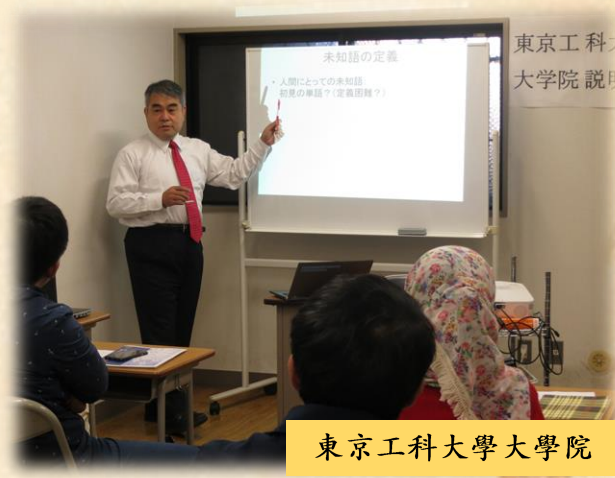
東京工科大学大學院 說明會