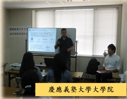
慶應義塾大學大學院