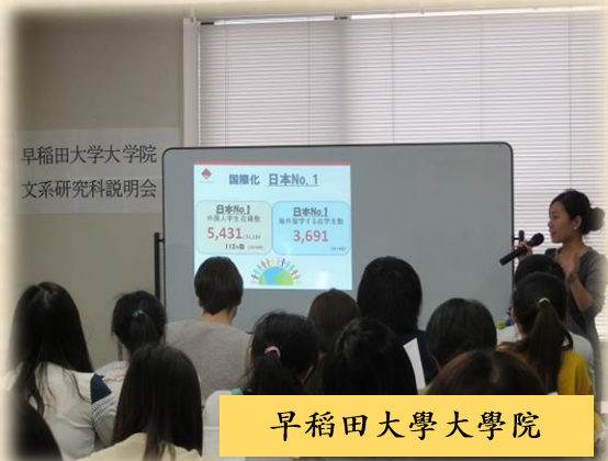
早稻田大學大學院

日本各大知名大學的研究所教授和留學生負責人，會直接蒞臨千駄谷為同學進行模擬授課及研究所本身的相關說明介紹。例如：學校特色、行事曆、畢業後的就業升學情況、學費、獎學金、專業方向、研究指導體制、入學考試概要、留學生支援等介紹。說明會上也設有問與答和個別諮詢的環節，各研究所也會為學生準備學校宣傳手冊、招生簡章和歷年考古題等資料。